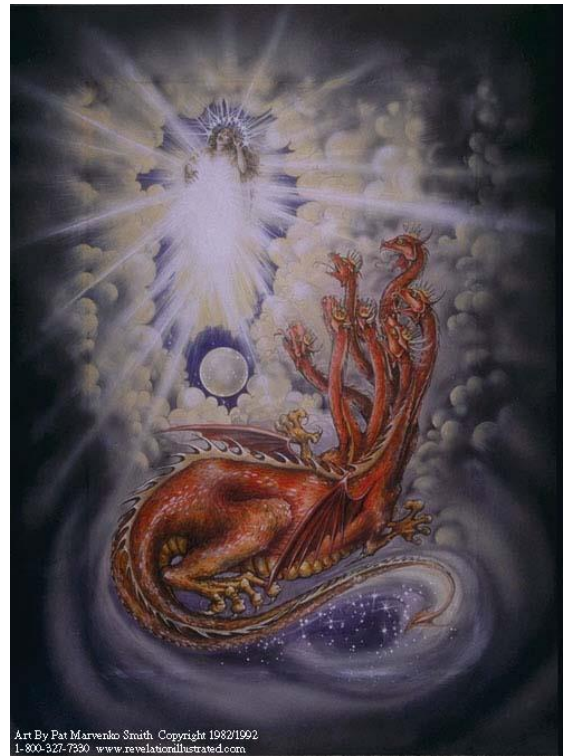
1-800-527-7390 www.revelationalillustrated.com

Satanás ainda continua a vencer muitas almas porque deixam de confiar no sangue, vence muitas mais porque deixam de dar testemunho de Jesus. Mas vence ainda muito mais porque amam as próprias vidas mais do que a Cristo. Selá . Lembremo-nos das sete promessas aos vencedores, nos capítulos 2 e 3. Podemos dizer que o Apocalipse é o “manual do vencedor”.